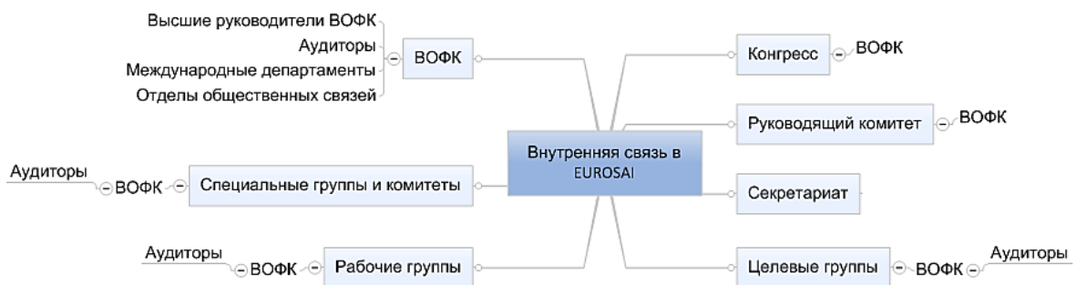
Таблица ниже показывает внутренние коммуникационные возможности EUROSАI. Из нее вытекает, что контакты между ВОФК и органами EUROSАI зависят, главным образом, от самих членов Организации. Улучшение наших взаимных контактов - путь к повышению качества аудита.