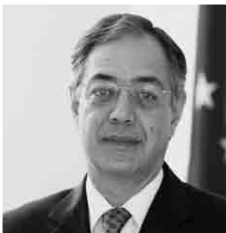
Председатель Европейской счетной палаты Витор Мануэл да Силва Калдейра.

Роль Председателя Счетной палаты определяется принципом primus inter pa-