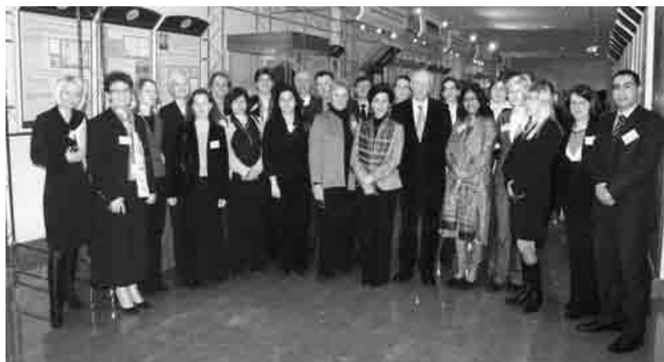
Участники XVI заседания Комитета EUROSAI по подготовке кадров.