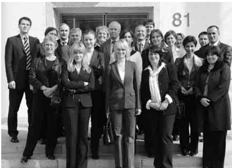
Участники XV заседания Комитета EUROSАI по подготовке кадров.