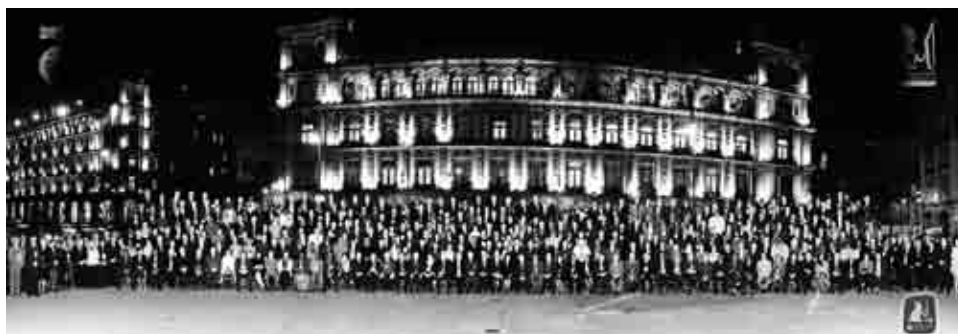
Делегаты XIX Конгресса INTOSAI