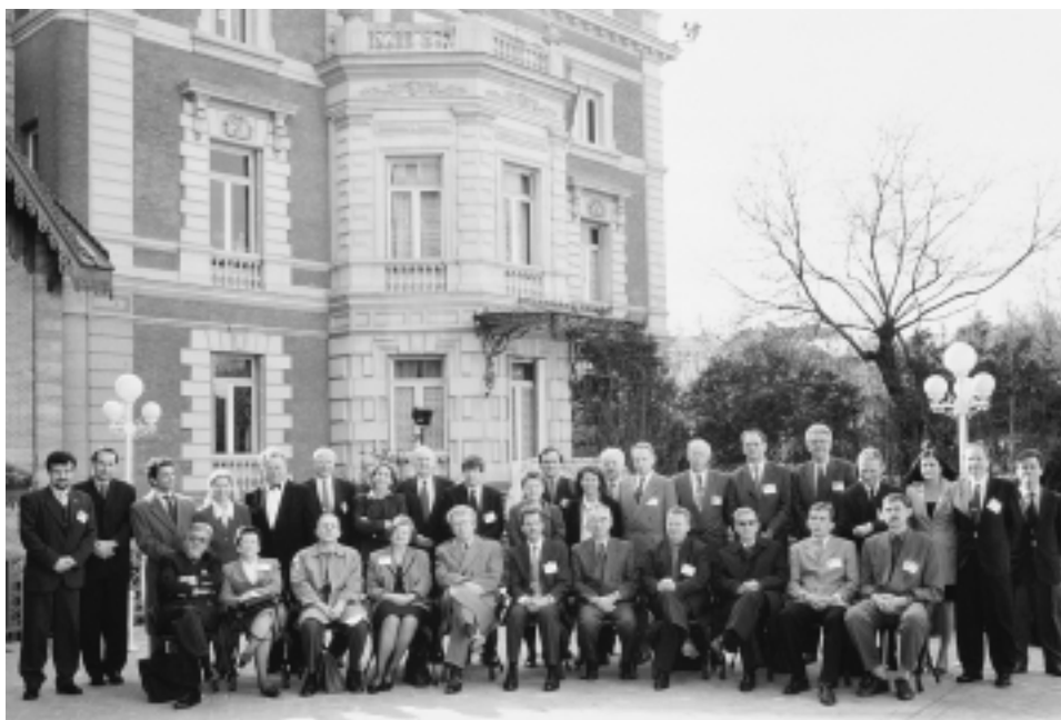
Участники XXII заседания Руководящего комитета EUROSAI.