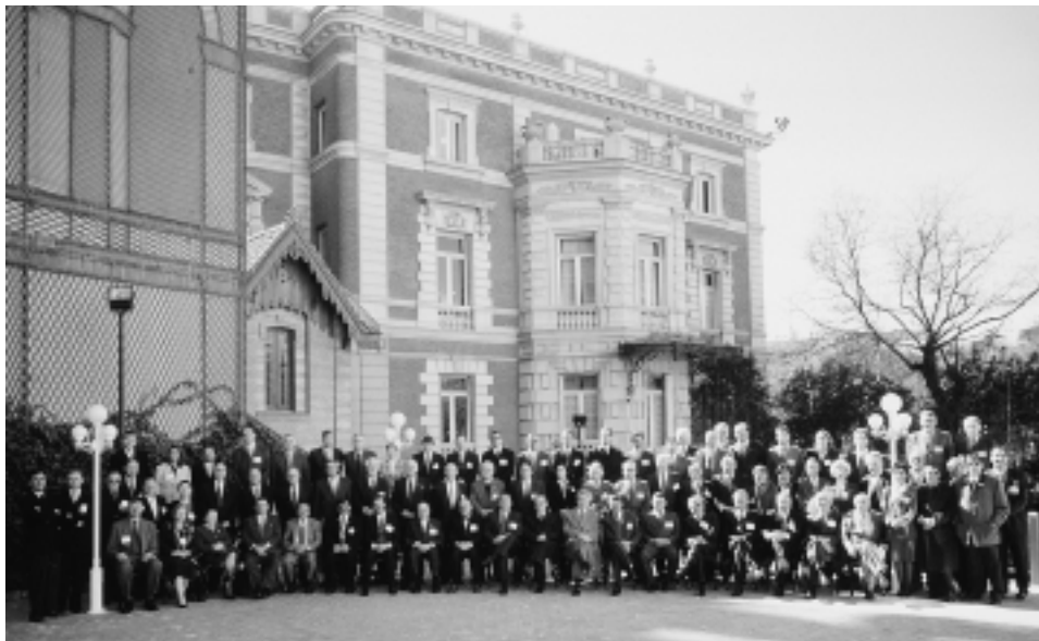
Ознакомительная встреча ВОФК Европы и Латинской Америки в Мадриде. 2000 год.