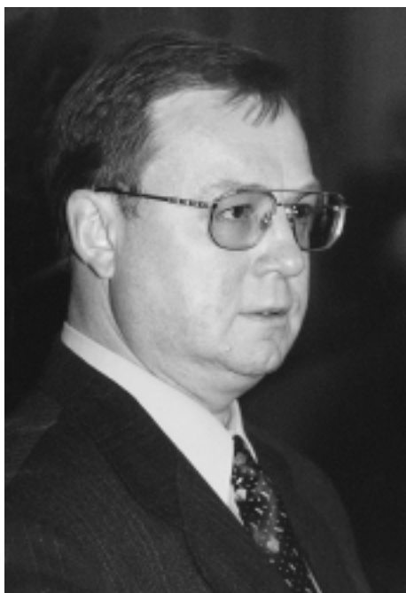
Сергей Вадимович Степашин, новый Председатель Счетной палаты Российской Федерации.

Г-н Степашин С.В. родился в 2 марта 1952 года в городе Порт-Артур. В 1973 году закончил Высшее политическое училище МВД СССР в Ленинграде, а в 1981 году Военно-политическую академию им. В.И. Ленина в Москве. Г-н Степашин С.В. – доктор юридических