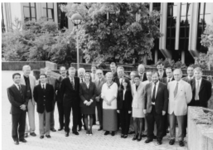
Встреча посредников по контактам ВОФК стран ЕС в Люксембурге 3-4 октября 2000 года.

законодательства и состоянию работы над внедрением цифровой системы связи между Высшими органами финансового контроля стран членов ЕС в рамках программы ТЕСТА.