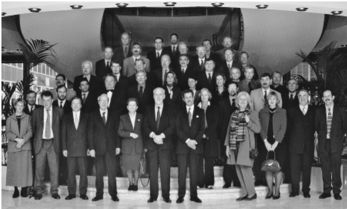
Групповая фотография участников встречи в Люксембурге.