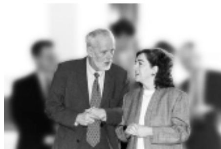
Председатель ЕСП г-н Ян О. Карлссон беседует с Европейским комиссаром по бюджетным вопросам, г-жой Мишель Шрейер.

направленную на обеспечение максимальной эффективности (поиск “оптимальной практики”) в управлении финансами, большей оперативности в платежах, более широкой подотчетности и, в целом, большей отдачи средств. Подробную информацию можно получить в Заключении 4/97 ЕСП.